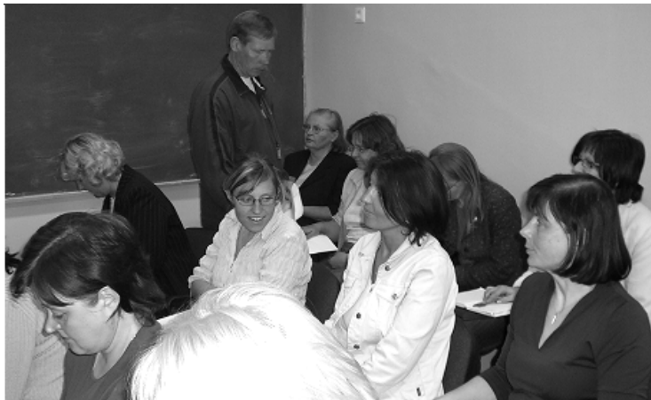
2005/06. õppeaasta töö otsustati hinnata "heaks"