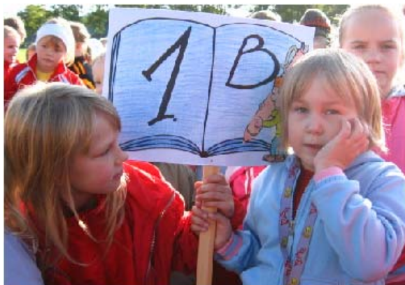
Kas nõnda see käibki?